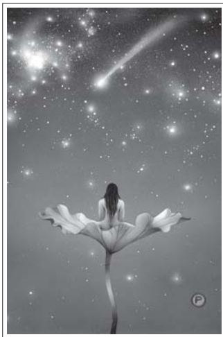
4 • OSHO – TAROTUL ZEN