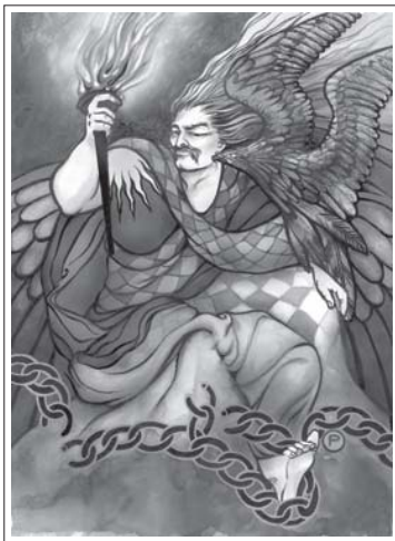
10 • OSHO – TAROTUL ZEN